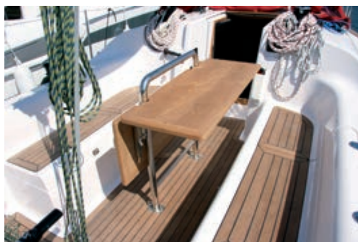
La mesa, de estructura tubular, es desmontable y cuenta con alas plegables, perfecto para el crucero.