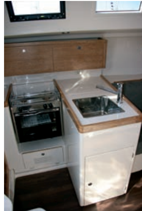
La envolvente cocina es completa y práctica.

entrada, de configuración envolvente, equipamiento básico y nevera de cofre de tapa algo pequeña. En cuanto a la mesa de cartas, dispone de buena superficie aunque se ha optado por un asiento poco generoso para facilitar el paso. El salón central queda determinado por una mesa de alas plegables, con botellero y el mástil que atraviesa la cubierta, además de dos largos asientos enfrentados en las