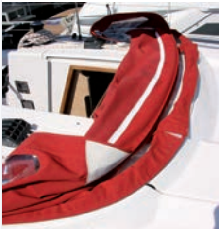
La gran capota camper.