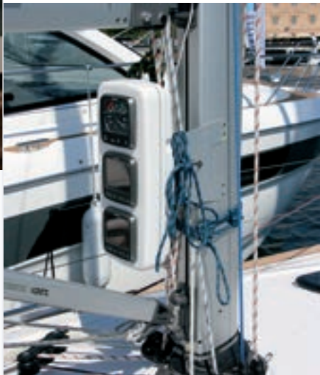
El soporte para los repetidores de electrónica.