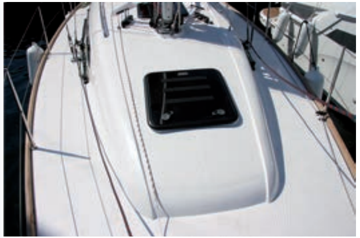
En la cubierta de proa incluye una escotilla de buen tamaño para pasar velas.