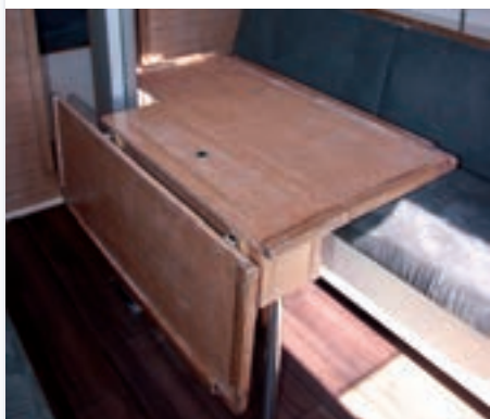
La mesa de dos alas y con botellero.