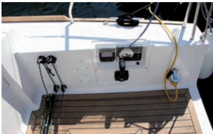
En la banda se sitúan las mordazas del carro de mayor y backstay y los mandos del motor.

todos los requisitos para trabajar adecuadamente con una tripulación profesional. Con un francobordo mediano, adopta una popa para dar volumen interior ancha y totalmente abierta, de fácil paso