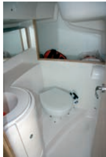
Este 33 pies disfruta de un aseo amplio con rincón para chalecos y trajes de agua.

Una electrónica mal calibrada no nos permitió marcar los ángulos de forma exacta, pero nos movíamos entre los 29 y 32° con una velocidad que superaba sin problemas los 6,8 nudos y llegó a superar los 7,4 nudos a un descuartelar. □ R. Masabeu