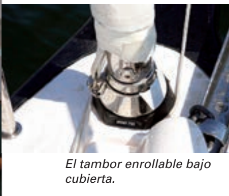
El tambor enrollable bajo cubierta.