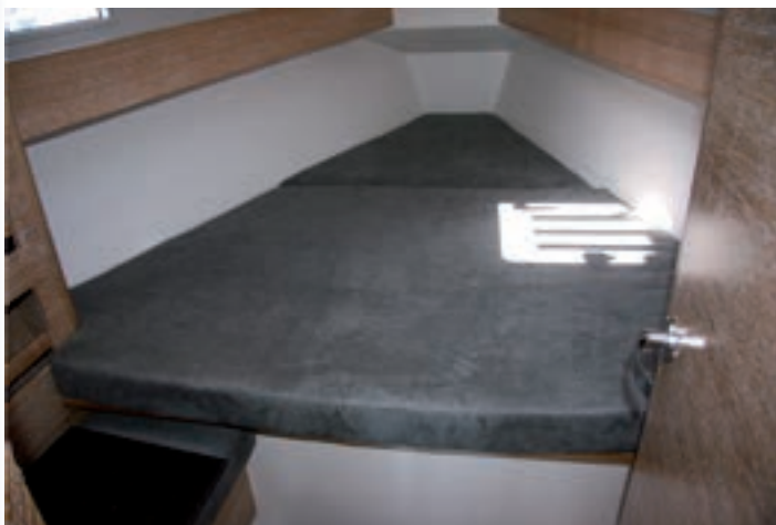
Una puerta independiza en proa un camarote con cama triangular.