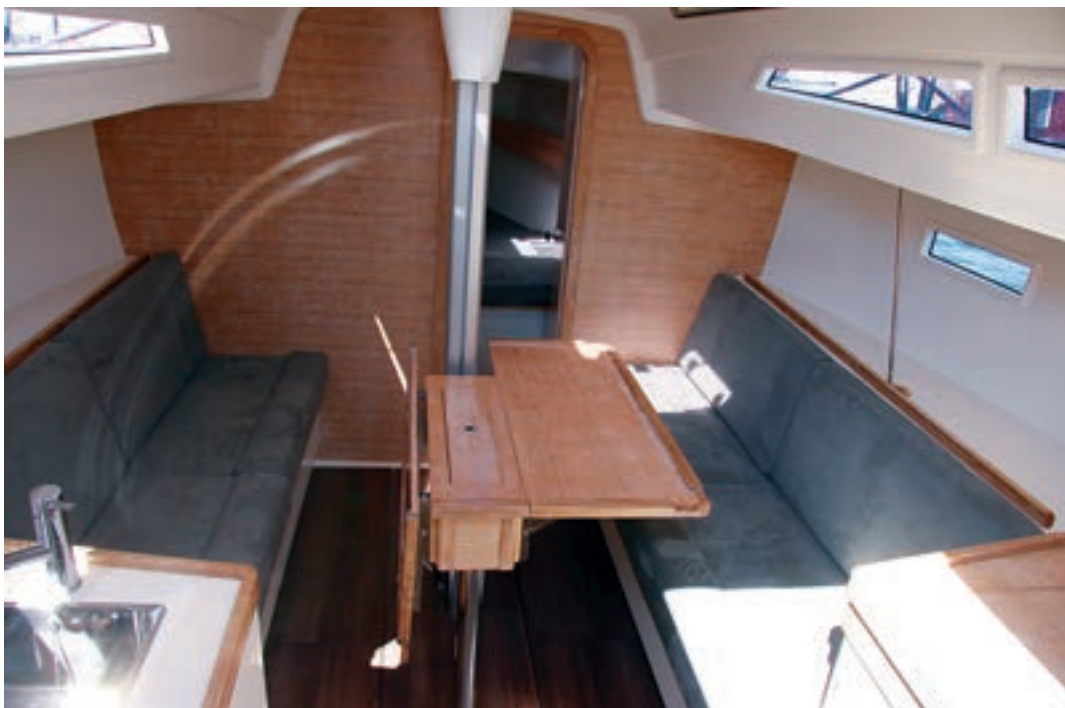
El Salona 33 disfruta bajo cubierta de una buena luminosidad y destacado volumen

Es evidente que, a pesar de vestir a este Salona 33 de crucero familiar, se trata de un modelo con grandes aptitudes para las regatas de distintas categorías, por lo que es necesario tratarlo como tal y