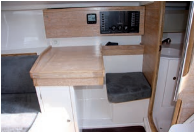
La mesa de cartas es grande y cumple a la perfección con la misión.