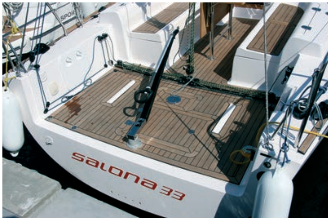
La popa queda totalmente abierta como corresponde a un moderno crucero-regata.