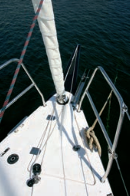
El largo botolón de carbono destaca sobre el balcón abierto y el cofre de anclas.

para no perder superficie, además de un largo botolón fijo de carbono para las velas portantes.